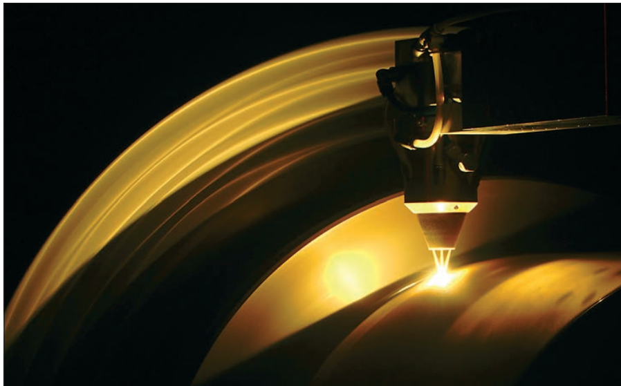
Durch Verschleißschutzbeschichtungen für Schneidwerkzeuge sind Laser längst auch in der Landwirtschaft präsent (im Bild die Beschichtung eines rotations-symmetrischen Bauteils).