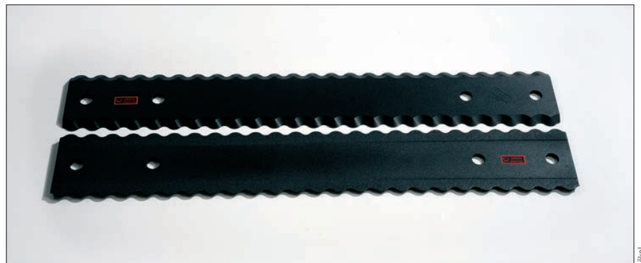
Der Beschichtungsansatz – hier am Beispiel von Jäkel Jadu-Stratum Wendemessern mit beschichteter Rückseite – hat sich so gut bewährt, dass Landwirte und Lohnunternehmer gezielt nach Laserbeschichtungen fragen.

Die Laserline GmbH mit Sitz in Mülheim-Kärlich bei Koblenz wurde 1997 gegründet. Sie ist ein international führender Hersteller von Diodenlasern für die industrielle Materialbearbeitung. Das Unternehmen blickt auf mehr als 20 Jahre Firmengeschichte zurück. Weltweit sind aktuell mehr als 5.000 Hochleistungsdiodenlaser von Laserline in unterschiedlichsten Prozessen und Anwendungen im Einsatz. Laserline beschäftigt derzeit rund 340 Mitarbeiter und verfügt über internationale Niederlassungen in den USA, Brasilien, Japan, China, Südkorea und Indien sowie Vertretungen in Europa (Frankreich, Großbritannien, Italien) und im asiatisch-pazifischen Raum (Australien, Taiwan). Weitere Infos unter https://www.laserline.com/de-int/